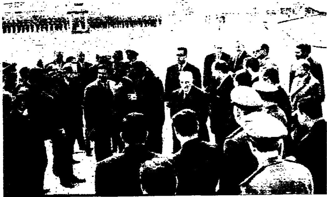
جلالة الحسين والرئيس عبد الناصر يفتتحان في مطار القاهرة وسط كبار المستقلين .

عمان - عاد حضرة صاحب الجلالة الملك الحسين المعظم الى عمان بعد ظهر امس بعد زيارته للقاهرة التي استغرقت يومين حيث التقى بسيدته آخيه الرئيس جمال عبدالناصر مرافقو الملك